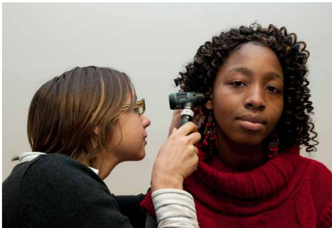
> Wijkgezondheidscentrum De Kaai in Gent, een van de 30 wijkgezondheidscentra die Triodos Bank financiert in België.