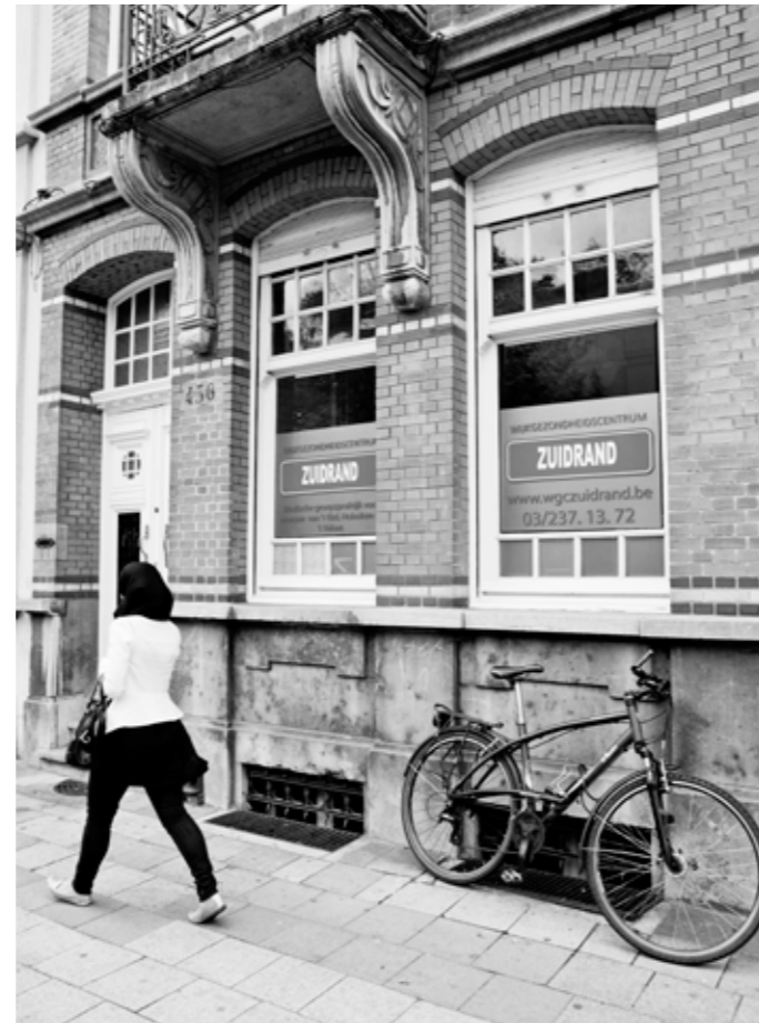
tekst LISA DEVELTERE

237.000 Belgen gaan gratis naar de dokter in een wijkgezondheidscentrum. De toegankelijke, wijkgebonden aanpak van die centra wordt steeds populairder. Sinds 2000 is het aantal in ons land zo goed als verdubbeld.